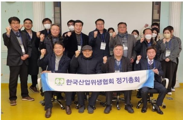
<2023 한국산업위생협회 정기총회>